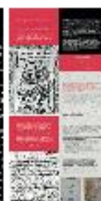
11 - Textos cristianos en al-Andalus (b) - #06 b