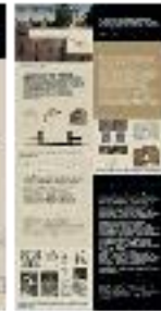
Fotogrametría arquitectónica (b) - #17 b