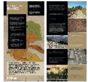
18 - Urbanismo islámico (a) - #13 a