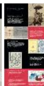
14 - Lingüística árabe (b) - #10 b