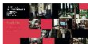
08 - Presentación grupo de filología, historiografía y crítica textual - #20