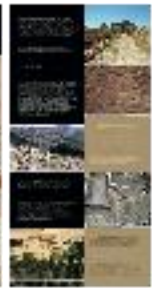
Urbanismo islámico (b) - #13 b