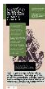
06 - Creación de la EEA (a) - #02 a