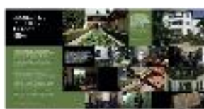
03 - Presentación EEA - #19