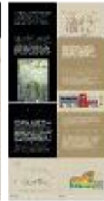
Arqueología de la arquitectura (b) - #16 b