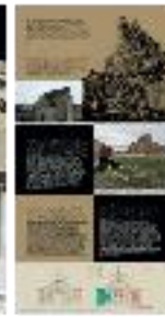
Arqueología de la tardeoantigüedad (b) - #12 b