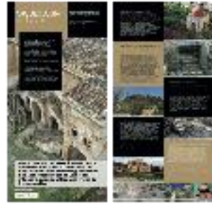
16 - Arqueología islámica (a) - #11 a