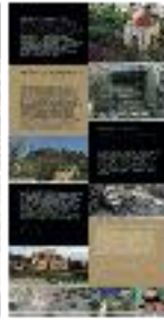
16 - Arqueología islámica (b) - #11 b