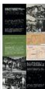
05 Restauración de la Casa del Chapiz (b) - #01 b