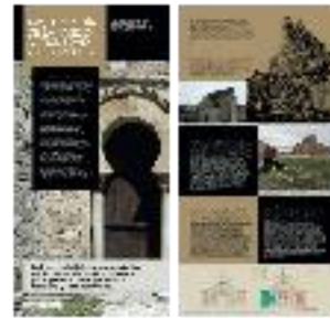
17 - Arqueología de la tardeoantigüedad (a) - #12 a