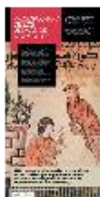
10 - Prosopografía de los ulemas (a) - #05 a