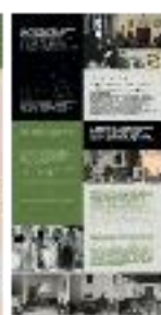
06 - Creación de la EEA (b) - #02 b