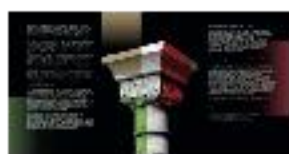
02 - Texto directora y comisario - #22