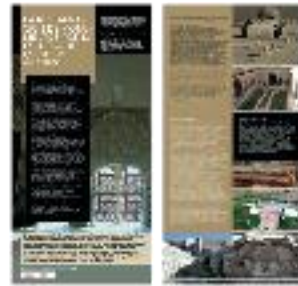
20 - Restauración arquitectónica (a) - #15 a