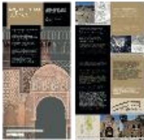
19 - Arquitectura islámica (a) - #14 a