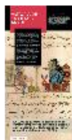
12 - Historia de la ciencia árabe (a) - #08 a