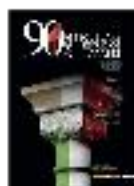
01 - Cartel - #18