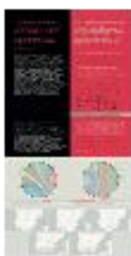
09 Redes de transmisión del saber (b) - #04 b