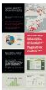
10 - Prosopografía de los ulemas (b) - #05 b