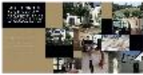
15 - Presentación Laboratorio de Arqueología y Arquitectura de la ciudad - #21