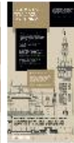
22 - Fotogrametría arquitectónica (a) - #17 a