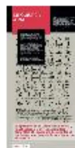
14 - Lingüística árabe (a) - #10 a