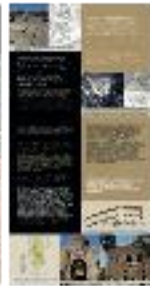
Arquitectura islámica (b) - #14 b