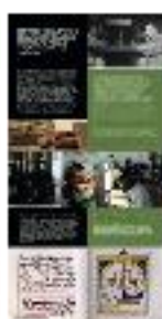
07 - Biblioteca (b) - #03 b