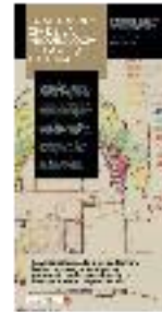
21 - Arqueología de la arquitectura (a) - #16 a