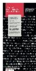
11 - Textos cristianos en al-Andalus (a) - #06 a