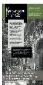
05 - Restauración de la Casa del Chapiz (a) - #01 a