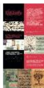
12 Historia de la ciencia árabe (b) - #08 b