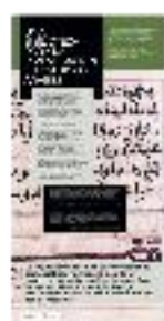
07 - Biblioteca (a) - #03 a