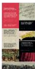
13 - Granada islámica y morisca (b) - #09 b