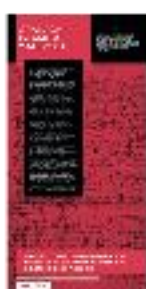
13 - Granada islámica y morisca (a) - #09 a