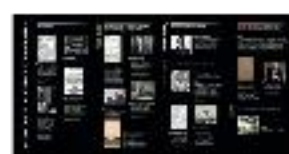
04 - Infografía línea cronológica EEA - #23