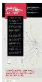
09 Redes de transmisión del saber (a) - #04 a