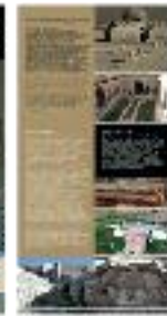
Restauración arquitectónica (b) - #15 b